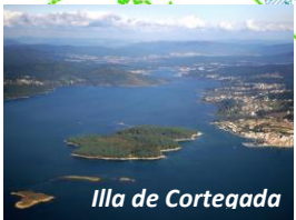
Illa de Cortegada