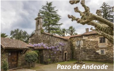
Pazo de Andeade