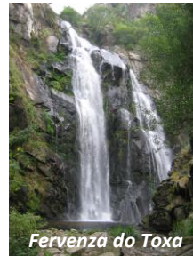
Fervenza do Toxa