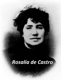
Rosalía de Castro

Termos que se poden asociar a este río tan importante.