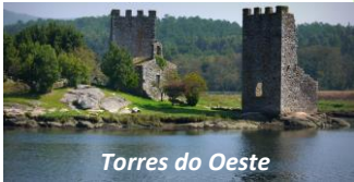
Torres do Oeste